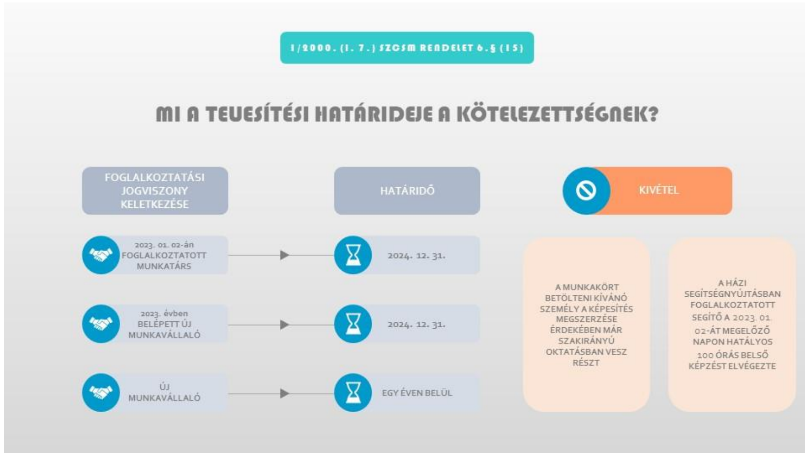
3. ábra A képzési kötelezettségi határideje