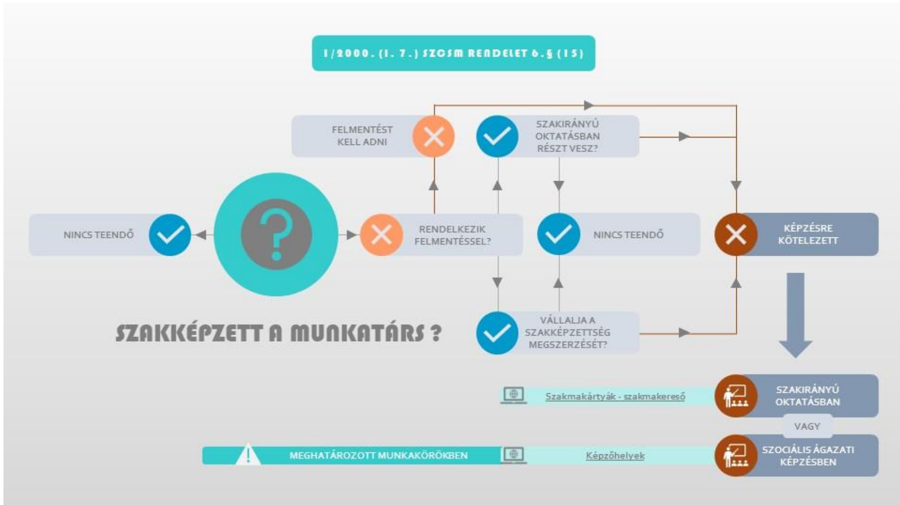
1. ábra Szakképzetlen munkatársak szakképesítési lehetőségei, igazolása