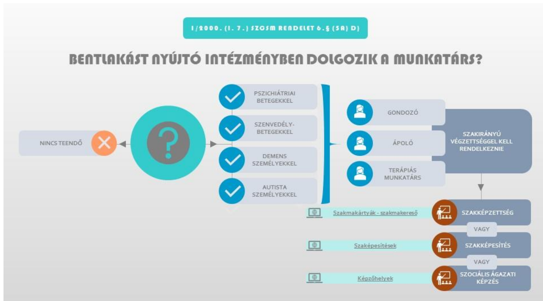
4. ábra Szakképzett, bentlakásban dolgozók továbbképzése